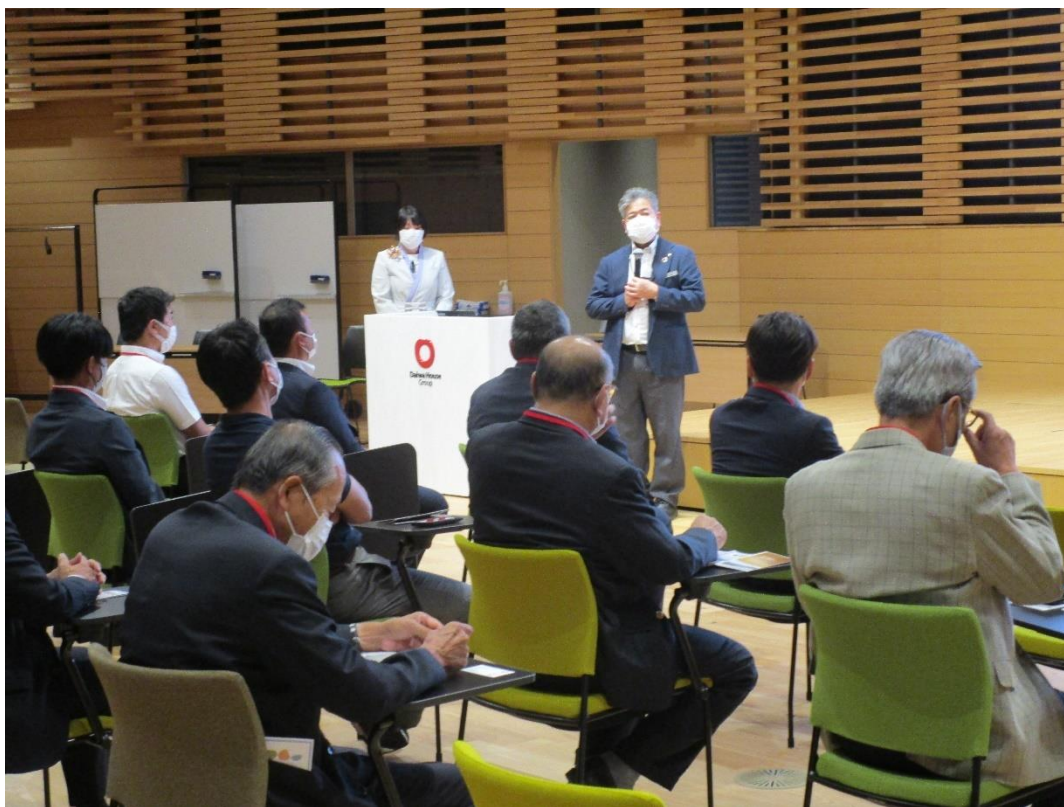
池端センター長 ご挨拶